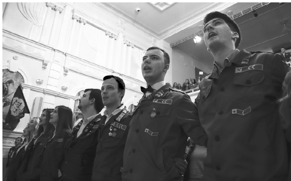
Донские студенческие отряды – это настоящее трудовое братство увлеченных будущих профессионалов

Сегодня донские студотряды – это 5 тысяч бойцов, 90 линейных отрядов. 1586 человек выбрали стезю стройотрядовцев, 1525 человек состоят в педотрядах, 782 бойца – на сервисном «фронте»,