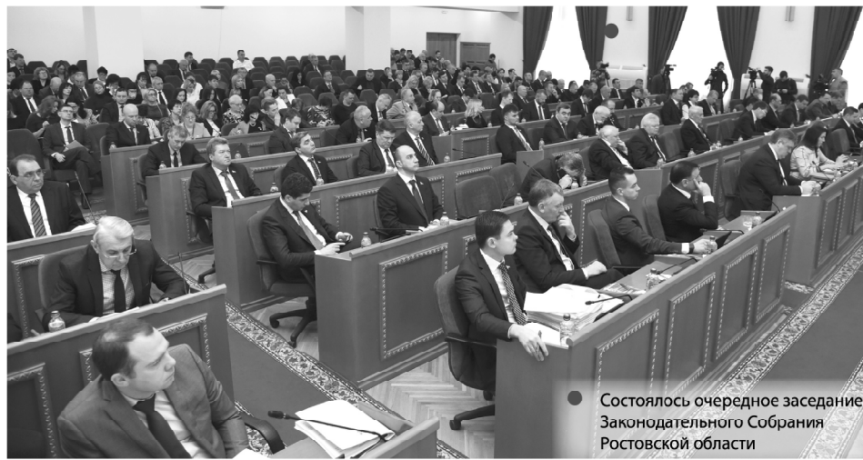
Состоялось очередное заседание Законодательного Собрания Ростовской области

– популяризация предпринимательства, государственной поддержки малого и среднего бизнеса, продвижение продукции и услуг, сертифицированных в системе «Сделано на Дону», Донского туристского продукта.