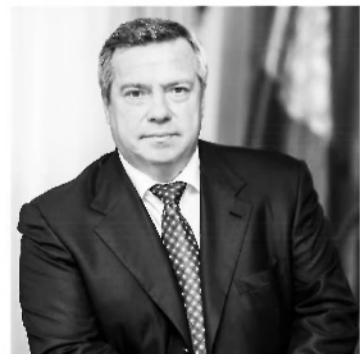
ВАСИЛИЙ ГОЛУБЕВ, губернатор Ростовской области.

“Развитие малого и среднего бизнеса - это дополнительные налоги в бюджет региона и новые рабочие места для его жителей”.