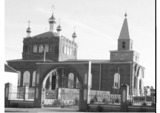
Иова, патриарха Московского и всея России.