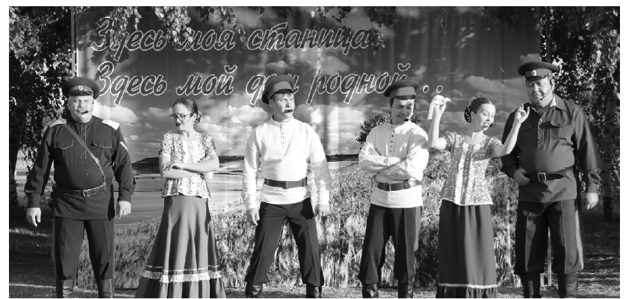
■ Выступает народная вокальная группа «Вишневый сад».

запечатлевшие на снимках красоту родных мест: А.Авсецин, Н.Ларин, Е.Обухова, А.Обухов, Н.Дьяков, М.Швец, С.Сорокина .