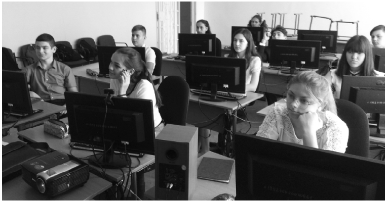
■ Ребята слушают информацию о правильном образе жизни.

Старшеклассники Обливской СОШ № 2 участвовали во Всероссийском открытом уроке «Будь здоров», направленном на привлечение внимания школьников к здоровому образу жизни. Трансляция урока была проведена на официальной странице Минпросвещения России в социальной сети «ВКонтакте».