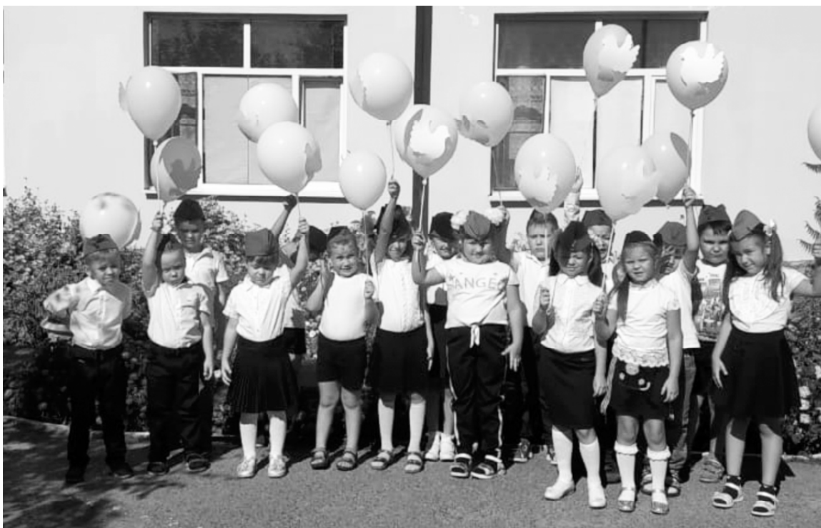
■ Ребята из подготовительной группы - участники праздника.

В первый день сентября в детском саду «Тополек» прошло праздничное мероприятие «День взросления».