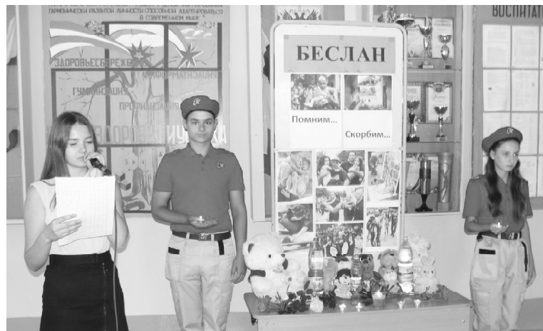
■ Идет радиолинейка.

В рамках проведения Дня солидарности в борьбе с терроризмом, 3 сентября в Обливской СОШ №2 прошла радиолинейка «Памяти жертв Беслана» под девизом: «Помним, скорбим...».