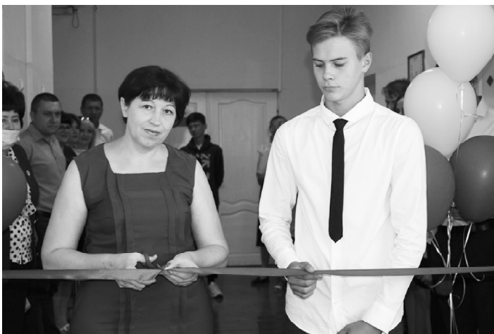
■ Перерезается «красная лента».

Настоящим подарком для учащихся и педагогических работников МБОУ Обливская СОШ №1 стало открытие Центра образования гуманитарного и цифрового профилей «Точка роста».