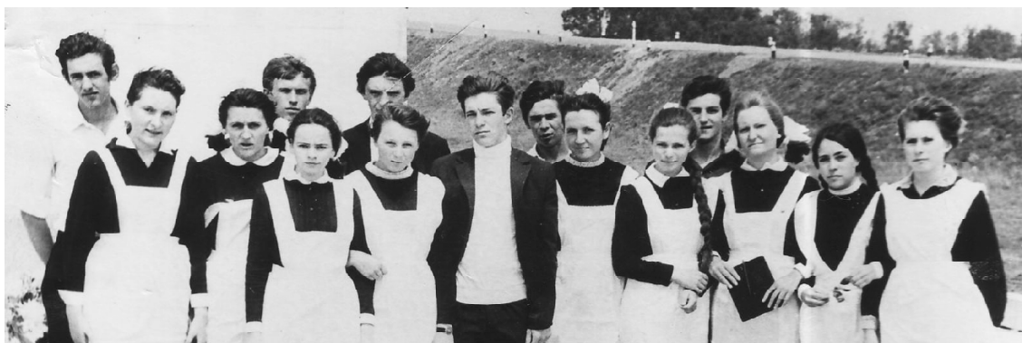
■ Ученики 10 В класса, 1970 год.

В этом году у нас состоялась юбилейная встреча – 50 лет пос-