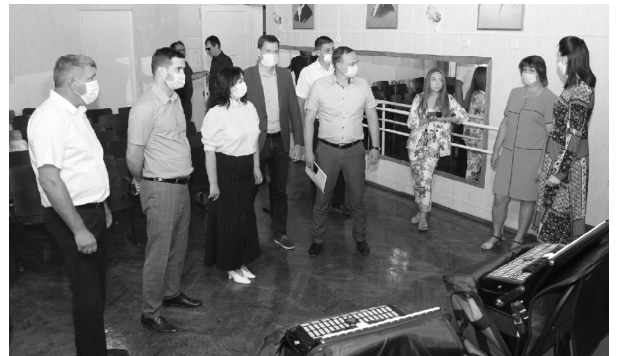
■ В Обливской Детской музыкальной школе.

Затем группа побывала в хуторе Кирееве, где осматрела Дом культуры, недавно открывшийся после капитального ремонта фасада и крыши. Средства на обновление сельского ДК тоже были получены в рамках нацпроекта «Культура» в общей сумме 5 миллионов рублей. Отремонтиро-